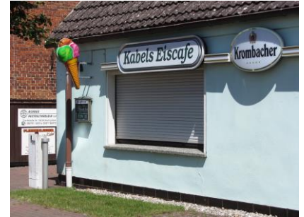
Eiscafe „Kabel „ in Groß Lüben