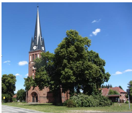
Kirche Groß Lüben

Wir nutzen jetzt die Straße und gehen ca. 300 Meter nach rechts bis zur nächsten Wegkreuzung. Hier führt ein Wirtschaftsweg bis Groß Lüben. An der Hauptstraße angelangt, wandern wir rechts entlang vorbei an der 1904 im neugotischem Stil errichteten Kirche, die man besichtigen kann. Wir überqueren die Hauptstraße und gehen weiter die Dorfstraße entlang. Am Eiscafe "Kabel" können wir einkehren und dann weiter bis zum Dorfeende laufen. Den Alten Wittenberger Weg biegen wir dann rechts ab und wandern wieder Richtung Bad Wilsnack. Dabei kommen wir an der CLEO Schreibgeräte GmbH vorbei. Hier befand sich seit 1533 eine Wassermühle in der noch bis 1963 die Staukraft der Karthane für das Mahlen von Getreide genutzt wurde. Über die Mühlenstraße vorbei an der Karthanhalle gelangen wir schließlich zurück zum Bahnhof, dem Ausgangspunkt unserer Wanderung.