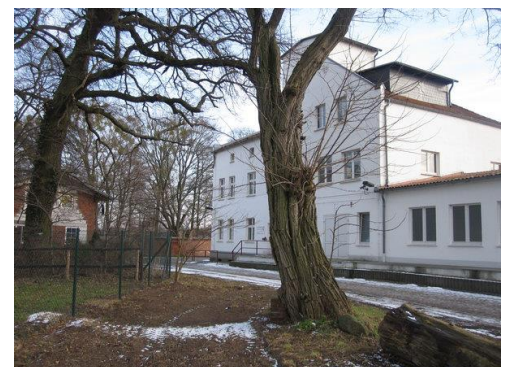
Cleo Schreibgeräte GmbH